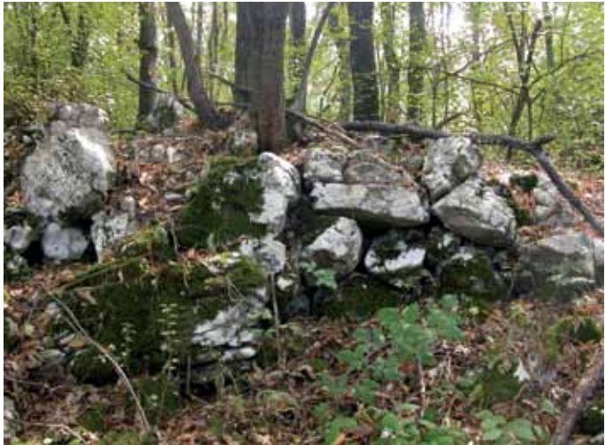
Сл. 3. Очувано спољно лице бедема Fig. 3 The preserved outer side of the walls

ували заштићен од ветра. Северна, западна и источна страна Вита под великим су нагибом, што отежава приступ фортификацији. Приступ је донекле олакшан са јужне стране где је најмања висинска разлика од пута до налазишта.