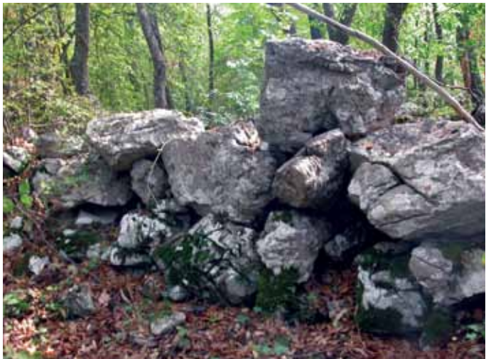
Сл. 4. Очувано спољно лице бедема Fig. 4 The preserved outer side of the walls