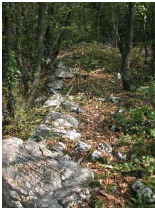
Сл. 5. Изглед круне бедема са северне стране Fig. 5 The view from north of the wall upper crown

Бедем има неправилну издужену форму око простора укупне површине од око 0,7 ха, а за његову основу са једне стране увек је коришћена природна кречњачка стена (сл. 2). Рађен је техником сухозида без коришћења везивних материјала и његова ширина износи од 2,5 до 3 м. Спољно лице бедема рађено је вештим уклапањем крупнијих комада камена, што је вероватно био случај и са унутрашњим лицем, које је испуњено ситнијим комадима камена (сл. 3-5). Најбоље су очувани бедеми са северне и источне стране фортификације, висине од 1,5 до 2 м, док је југозападна страна данас најмање уочљива на терену. Осим констатованог моћног северног бедема, преко целог локалитета, правцем И-З прелази неправилна сувомеђина, састављена од ломљеног камена покупљеног на лицу места. По начину градње, дебљини, очуваности и правцу пружања, она не представља део самог локалитета и изграђена је знатно касније, вероватно, као физичка граница између шумских парцела.