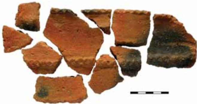
Сл. 7. Налази фрагментованог лонца Fig. 7 Finds of fragmented pot