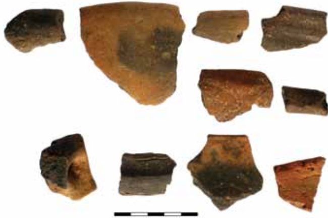
Сл. 6. Налази фрагмената здела Fig. 6 Finds of pottery sherds

Код таквих праисторијских градина земља и камен формирају грудобран у комбинацији са рововима и, вероватно, са дрвеним палисадама и препрекама. У великом броју случајева, бедеми врло често блокирају приступ утврђењу са само једне, најприступачније стране, док је на овом локалитету присутан непрекидан, правилно озидан бедем израђен у техници сухозида који је сличнији градинама гласиначке културе (Ћовић 1987: 576).