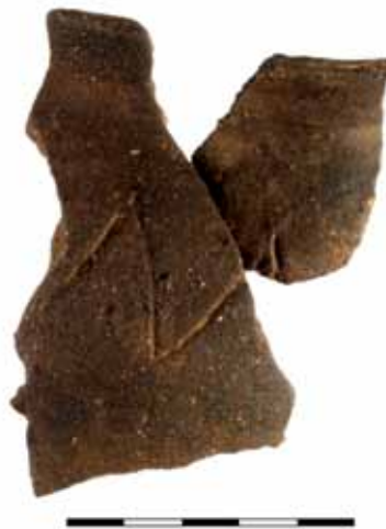
Сл. 8. Фрагмент локалне грнчарије из IV века

Подаци који су прикупљени површинском проспекцијом представљају јаку индикацију за постојање добро очуване фортификације из периода старијег гвозденог доба, какве се ретко срећу на нашем терену. Закључке добијене на основу ових