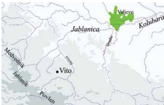
Сл. 1. Положај налазишта у односу на Ваљево Fig. 1 The location of the site in relation to the town of Valjevo